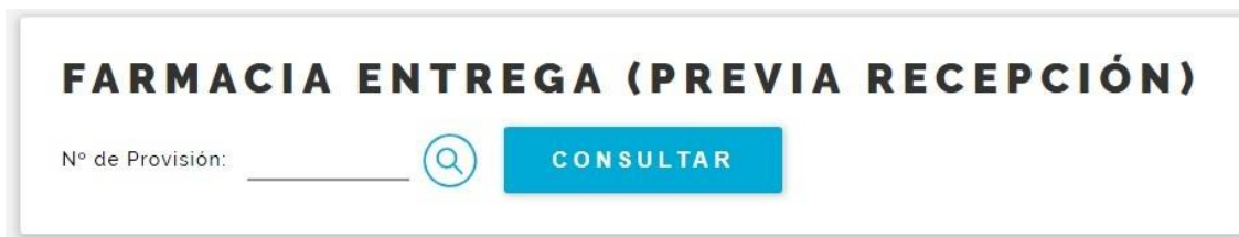
Fig. 8 Farmacia Entrega (Previa Recepción), paso 1

7) Ahora veremos en detalle la opción “Farmacia Entrega (Previa Recepción)” del menú de insulinas – compra local (Fig. 3).