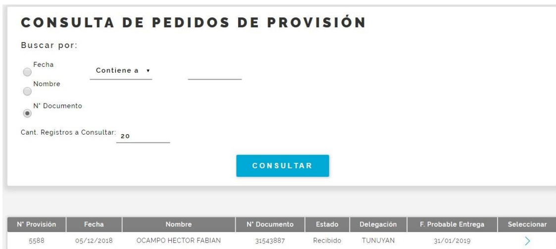
Fig. 9 Consulta de Pedidos de Provisión, Farmacia Entrega (Previa Recepción)

8) Ingresamos un número de provisión que se encuentre en estado “Recibido”, o lo seleccionamos desde la ventana de consulta, y presionamos el botón “Consultar”. Se abrirá una pantalla que nos muestra los datos de la provisión y el detalle de los medicamentos recibidos.