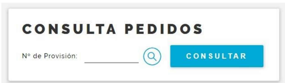
Fig. 17 Consulta Pedidos, paso 1

13) Ahora veremos en detalle la opción “Consulta Pedidos” del menú de insulinas – compra local (Fig. 3).