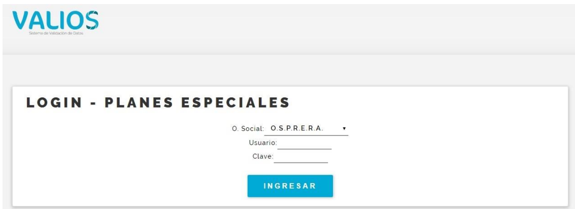
Fig. 2 Login de Ingreso