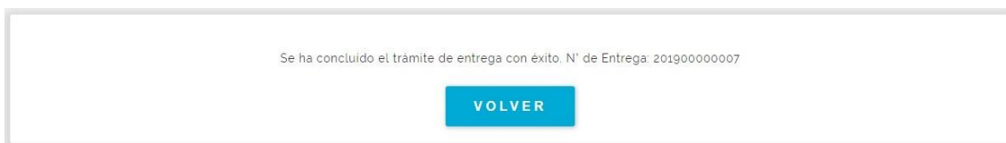
Fig. 16 Farmacia Entrega, confirmación

13) Ahora veremos en detalle la opción “Consulta Pedidos” del menú de insulinas – compra local (Fig. 3).